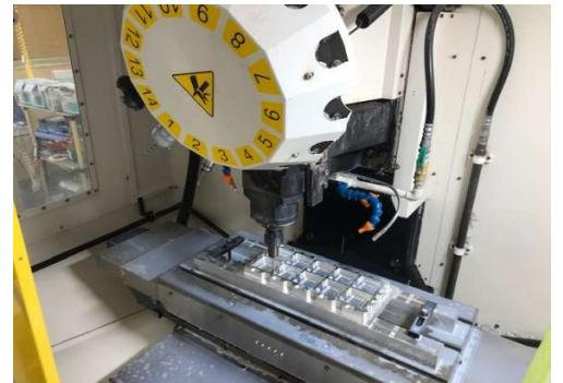
CNC機 computerized numerical control 2019年6月導入